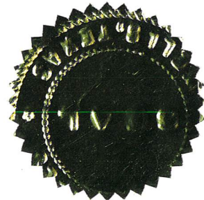
_____ Date of Adoption (Fecha de adopción)